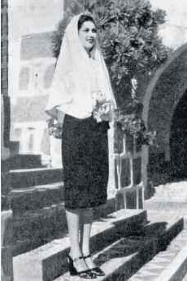
Mujer canaria luciendo la típica mantilla blanca. Año 1952.

Santa y Corpus; destacando en nuestra isla la mantilla blanca en la procesión de san Juan (Aruca), y la mantilla negra en la Semana Santa de Las Palmas de Gran Canaria. En la década de los años 30 del pasado siglo XX se pone de moda nuevamente esta mantilla y surge una variante o derivación de la misma, nos referimos al “clarín”. Realizado con los mismos materiales y usando las mismas técnicas el clarín era de forma triangular y de menores dimensiones. Su uso, junto a la utilización del velo, se hizo obligado desde la postguerra hasta los años 70 del siglo pasado para asistir a actos religiosos, y también como señal de luto.