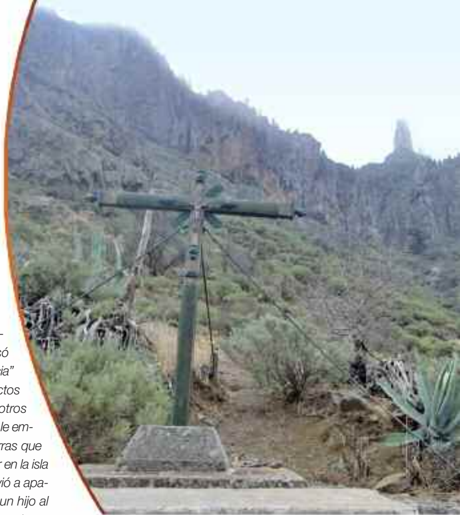
Primitiva cruz de Constantino.

–¿Desapareció la primitiva cruz y colocaron una nueva mucho más pequeña, cuando en 1964 se instalaron en el lugar las antenas de la emisora Radio ECCA?