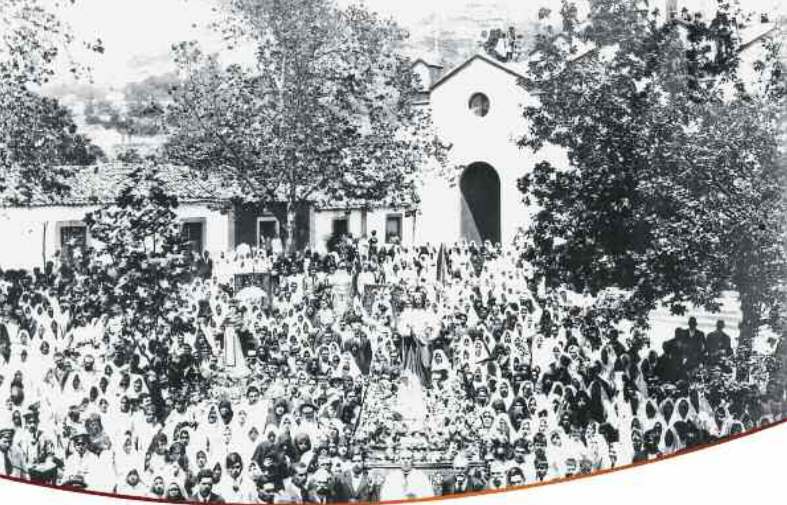
Multitudinaria procesión de San Vicente y el Corazón de Jesús. Apréciase la multitud de mantillas blancas. Año 1925.