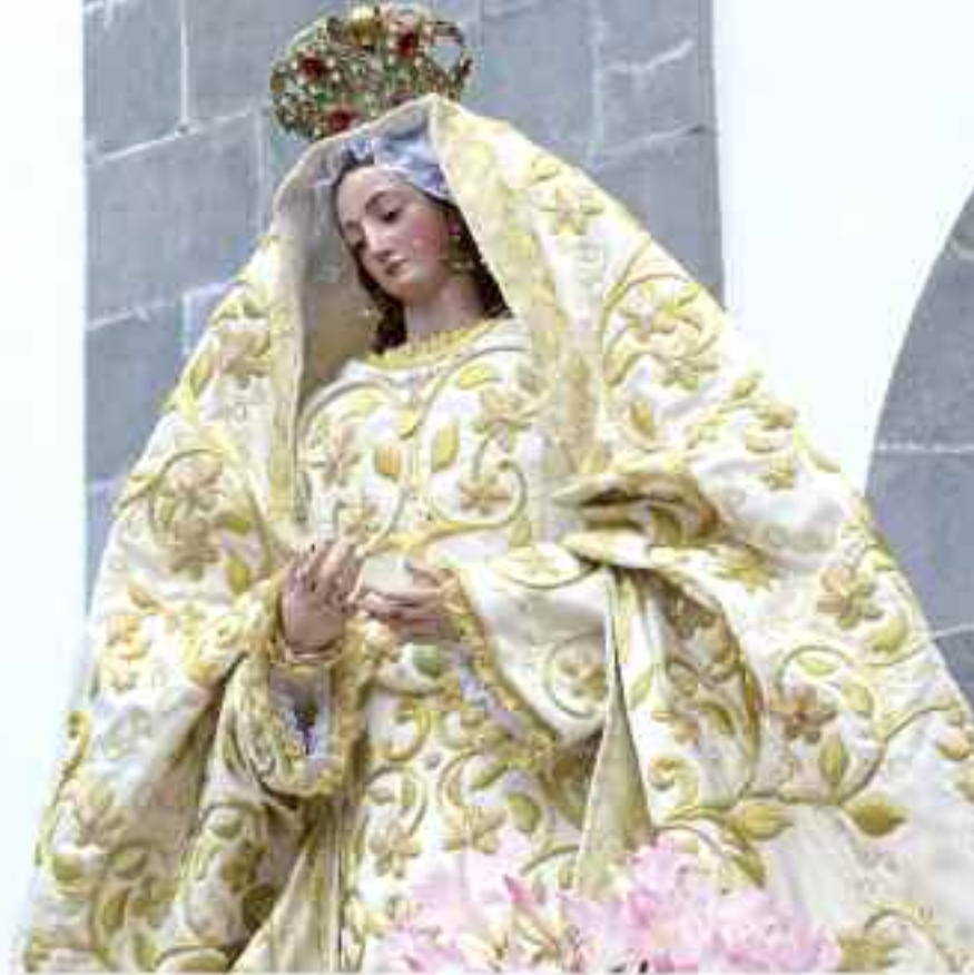
Procesión de Ntra. Sra. de la Encarnación. Año 2014.