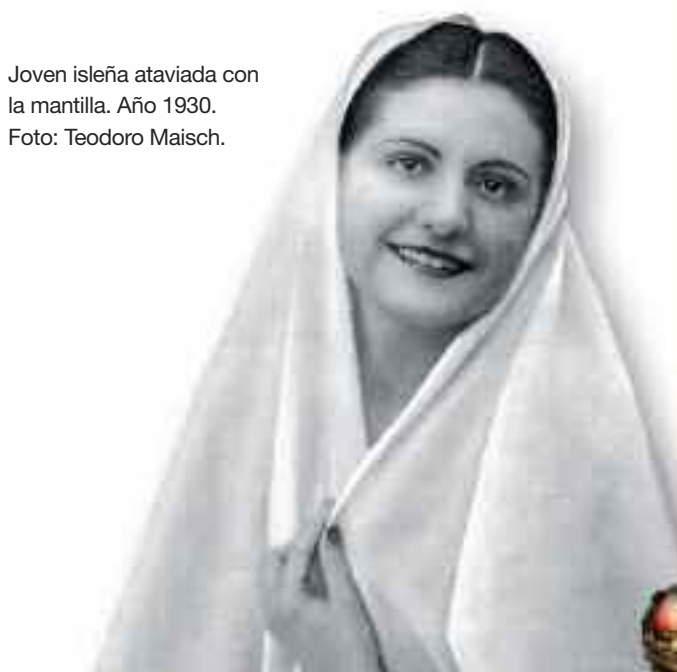
Joven isleña ataviada con la mantilla. Año 1930.

Esta mantilla se llevaba con peineta de teja, llamada así por su forma, y se realizaba en fino nácar artísticamente calado. Durante el siglo XIX su uso decae de tal manera que a principios del siglo XX su utilización se limita a actos puramente religiosos como procesiones de Semana