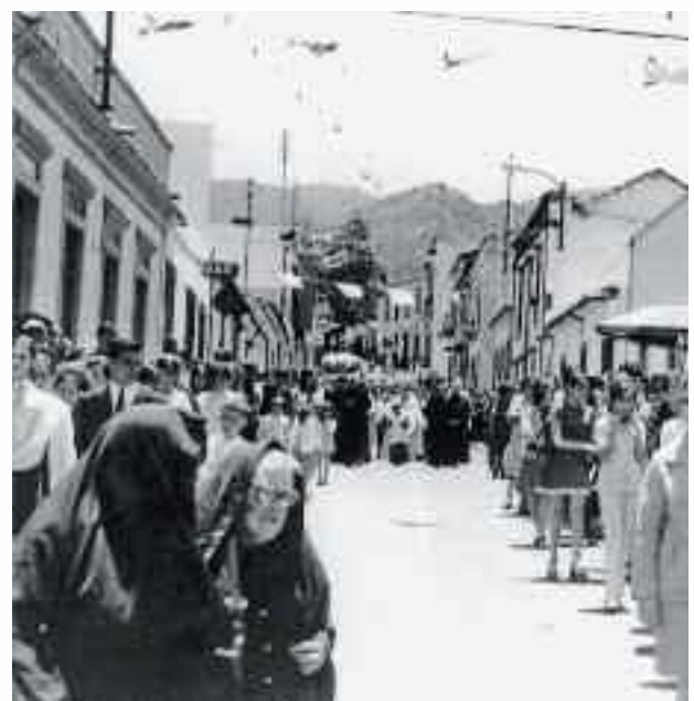
Procesión de San Vicente. En primer término dos señoras tocadas con la mantilla negra. Año 1972.

Escribir sobre la mantilla en Gran Canaria en plan resumido se me antoja definirlo como una tarea sumamente comprometida, puesto que resulta difícil concretar toda la enorme y rica historia de esta pieza. Las primeras noticias de la mantilla en nuestra isla datan de finales del siglo XVI, donde se la conocía como “mantellina”. Era de