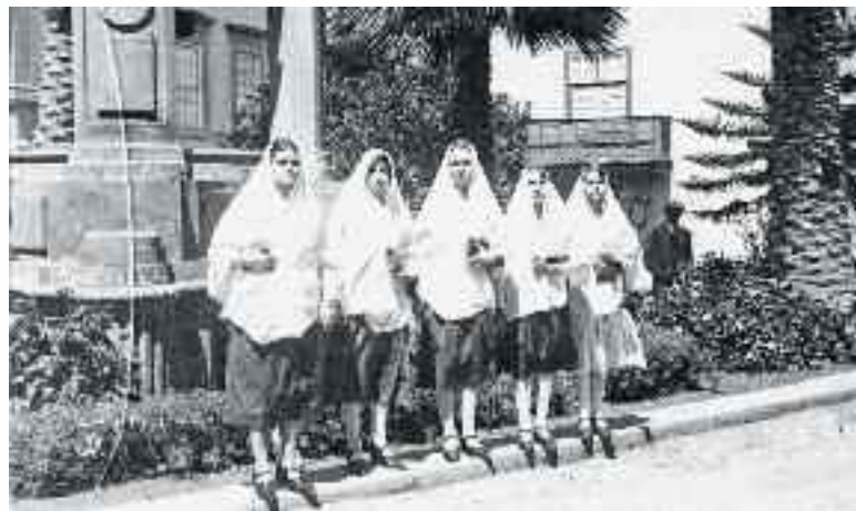
Tarjeta-postal de grupo de señoritas con mantilla. Las Palmas de Gran Canaria. Años 1925-30.

Durante el siglo XVIII tiene lugar en toda España una serie de cambios económicos y sociales que afectan muy pro-