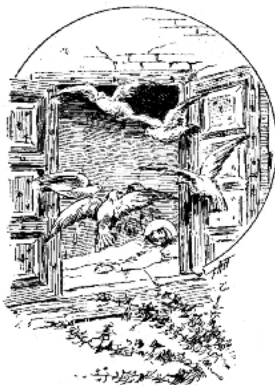
Dibujo a plumilla extraído del libro Vida de San Vicente del Apostolado de la Prensa, Madrid, año 1912, representando la muerte de san Vicente acaecida santamente en Vannes, el 5 de abril de 1419.