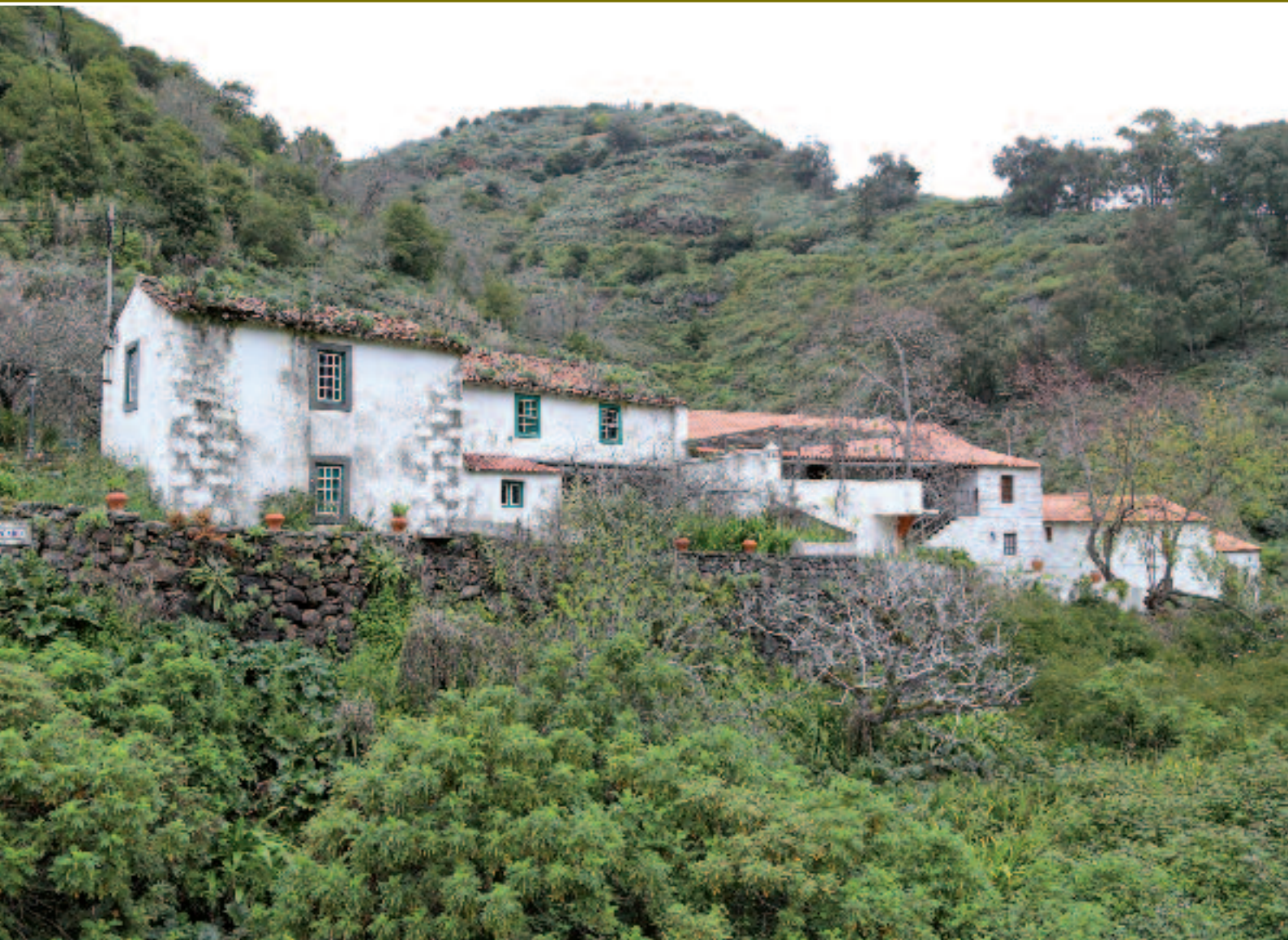
Caserío típico perteneciente a la Finca del Cercado (Barranco de la Virgen)