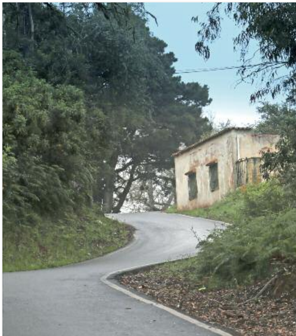
Cuesta de La Laguna.