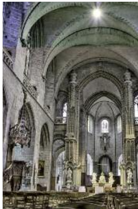
Antiguas tarjetas postales de la catedral de San Pedro (Vannes) donde está sepultado nuestro patrono. Su estilo es gótico flamígero, es decir, la última etapa de este estilo.

número entraron por ella unas cándidas y hermosas palomas, exhalando tan suaves y fragantes olores, que cuantos se hallaban en el aposento juzgaron ser espíritus angélicos que, tomando la forma de aquellas aves, celebraban la entrada de san Vicente Ferrer en las mansiones celestiales.