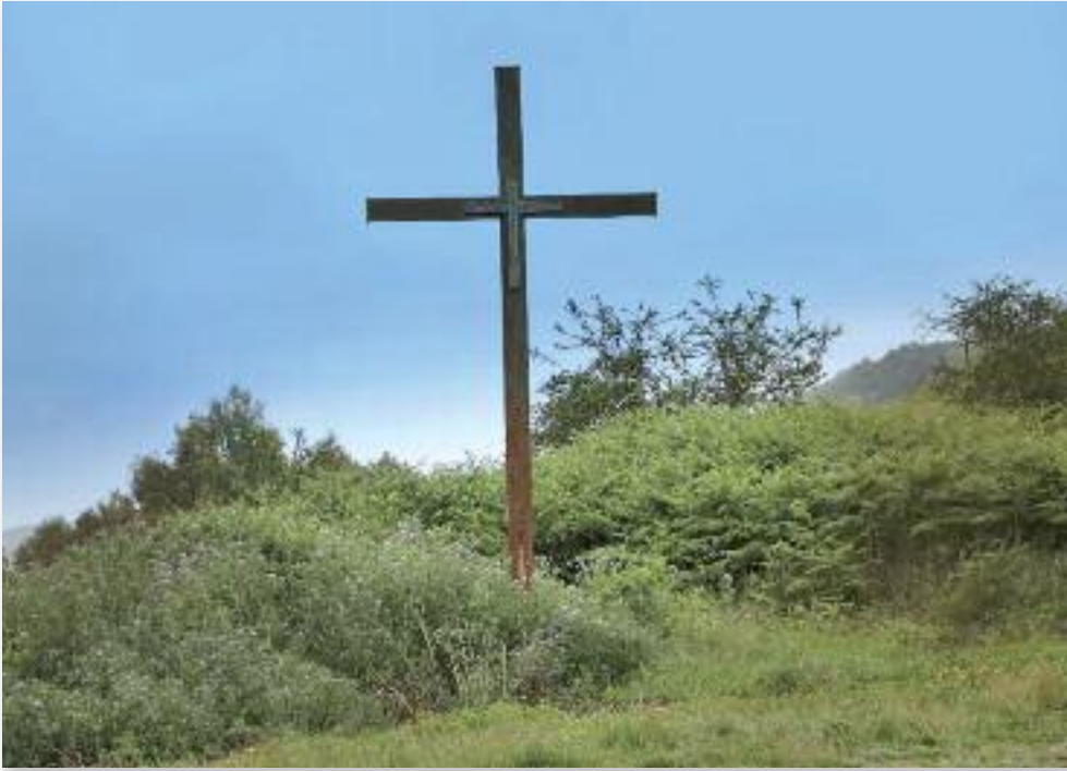
La Cruz de La Laguna.