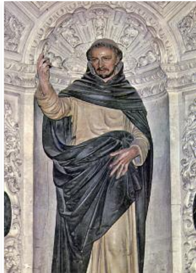
Tarjeta postal. Uno de los altares principales de la catedral de Vannes está dedicado al santo dominico, con su hornacina y espléndida imagen, ambas barrocas.

A medida que iba pasando el tiempo, la enfermedad iba en progresivo aumento, con fiebres altas, e intensísimos dolores, que le hacían permanecer en cama. En el transcurso de la misma no aceptaba medicación alguna, ya que sabía que el Señor trataba de que por medio de la enfermedad llevarse al descanso eterno; también rehusó comer carne, ni siquiera tomar cocido alguno que la conllevara. Tampoco quiso vestir camisa, sino túnica de lana, aunque pudieron conseguir aquellas piadosas hijas espirituales que le asistieron, que se quitase el asperísimo cilicio de cerdas que toda su vida llevó como un jubón.