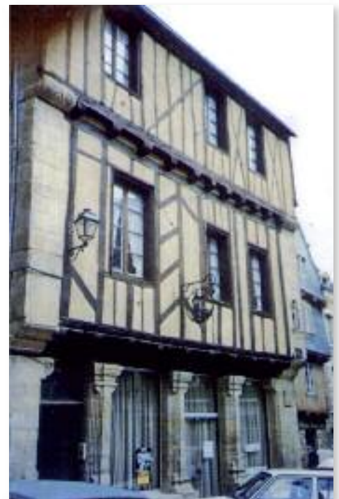
Fachada de la casa de Vannes (Francia), donde vivió sus últimos días, falleciendo en ella.

Le fueron a visitar el día 27 de marzo el obispo don Mauricio, los magistrados de la ciudad y toda la nobleza de Vannes, afligidos de que los dejase su buen padre, quien, vuelto a ellos, entre otras muchas y