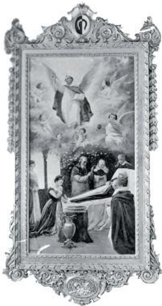
Antigua estampa que representa a san Vicente en su lecho de muerte, acompañado por discípulos de su hábito.

devotísimas palabras, les dijo las siguientes: "Mis carísimos hijos, no os aflijáis por mi partida, antes dadme mil enhorabuenas de que el Señor me quiere de esta vez llevar a su