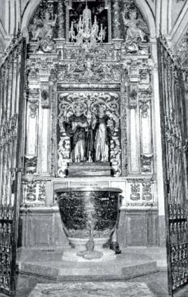
Pila bautismal de San Vicente. Iglesia de San Esteban (Valencia). Foto año 1964.

Valencia, como canastillo de flores, se sienta sobre una extensa llanura que el Turia serpentea y vivifica, dando origen a una vegetación variada y opulenta. Arrullada continuamente por el Mediterráneo, el perfume de sus jardines embalsama el ambiente y recrea el corazón de nativos y visitantes.