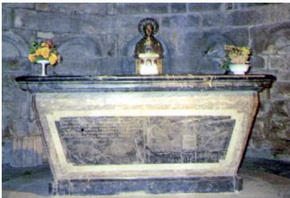
Sepulcro del santo, en la capilla de la izquierda de la catedral de Vannes.

Luego que expiró el santo, manifestó el cielo con un prodigio su dichoso tránsito a la gloria, y fue que, de repente y por sí misma, se abrió la ventana de su cuarto, y en crecido