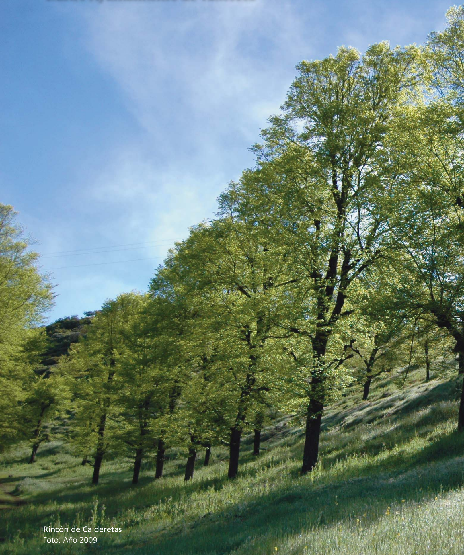
Rincón de Calderetas Foto: Año 2009