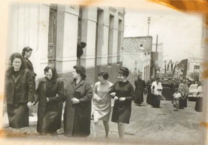
Procesión. Año 1969