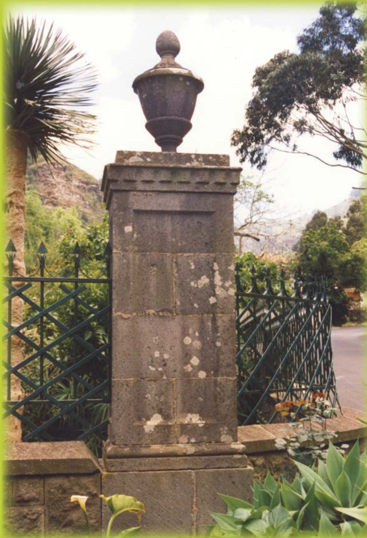
Detalle en la entrada de la Casa de La Peña Barranco de la Virgen