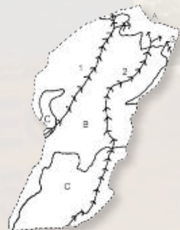
Mapa. Caminos y zonación prehispánica

Podemos citar tres caminos de tránsito desde las zonas de medianías hasta la cumbre, caminos que servirían para una trashumancia estacional que practicaban los aborígenes en la isla de Gran Canaria, son: el camino de Teror a la cumbre, que pasaría por el barranco de Madrelagua, Calderetas y Peñones; el camino de Fírgas a la cumbre, atravesando el Barranco de la Virgen, Valsendero y el Andén; y por último el camino de Gáldar a la cumbre, atravesando el barranco del Gusano, Pinos de Gáldar hasta alcanzar las faldas de Montañón Negro, donde contacta con el municipio de Valleseco (Mapa). La existencia de los caminos implica la instalación de campamentos semipermanentes en las zonas de pastoreo y a lo largo del camino, Las Cuevas del Andén probablemente fueron uno de estos campamentos.