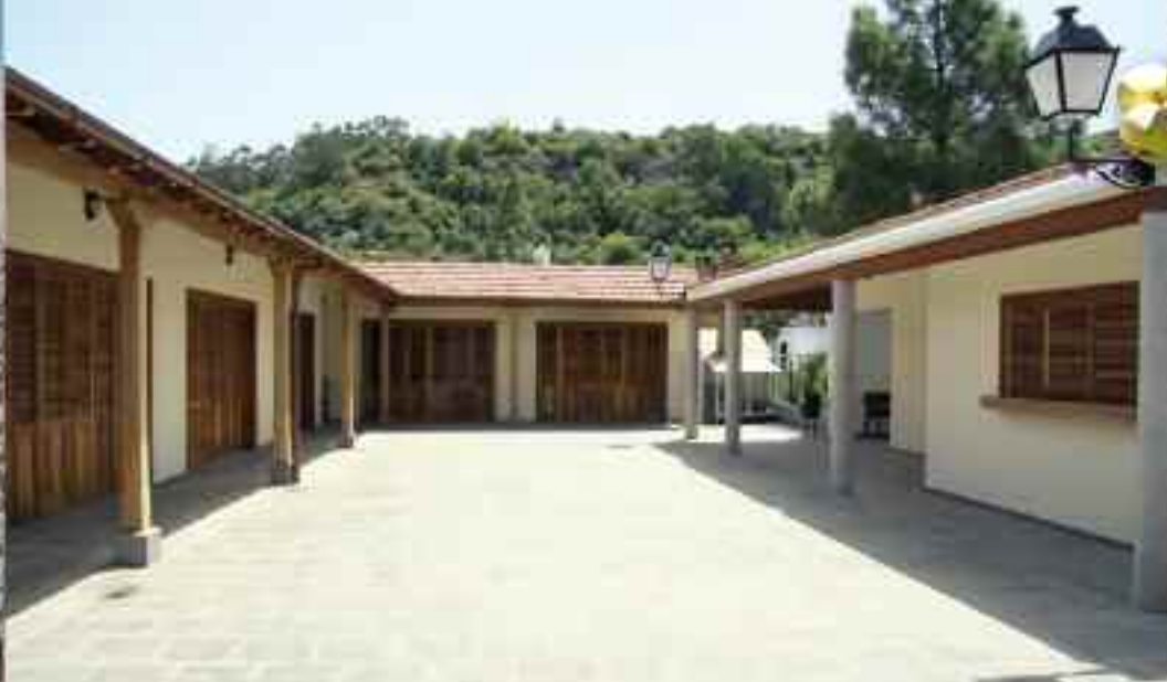
Mercado Ecológico "EcoValles".