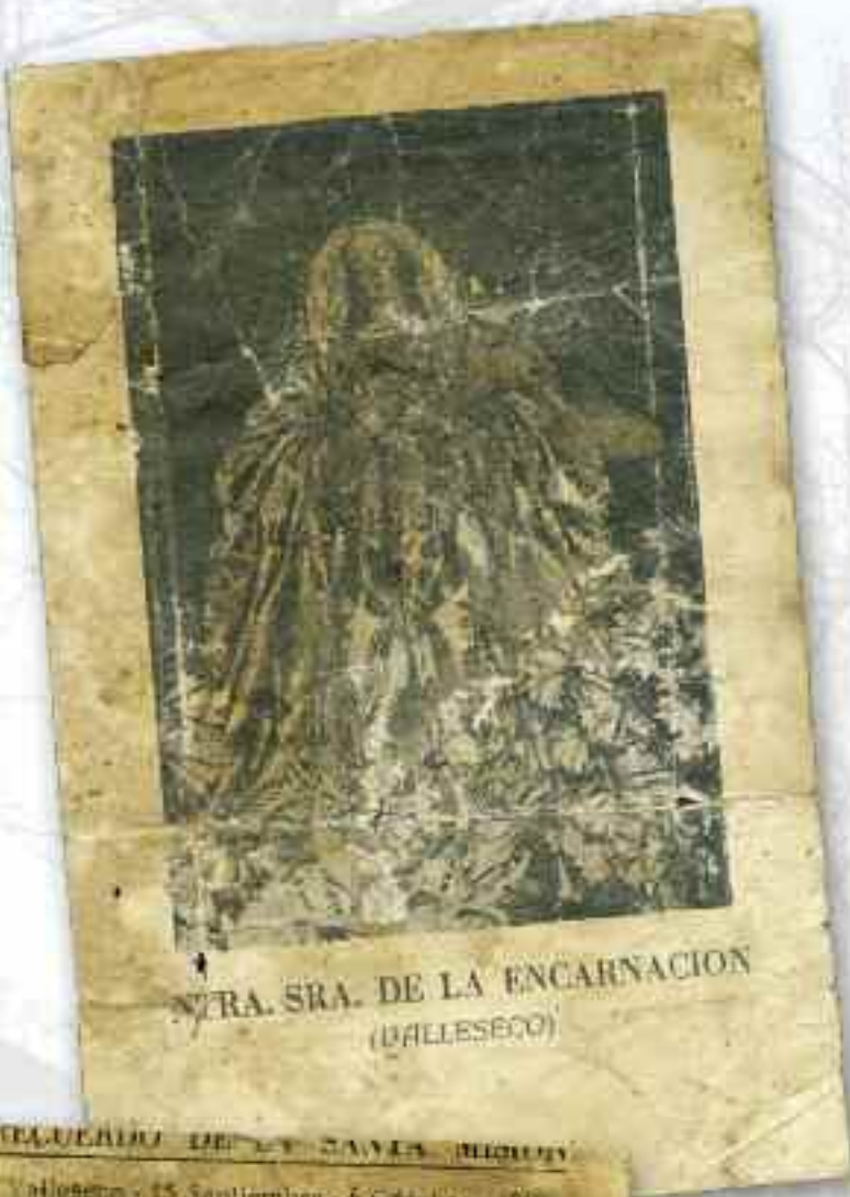
NTRA. SRA. DE LA ENCARNACION (VALLESECO)